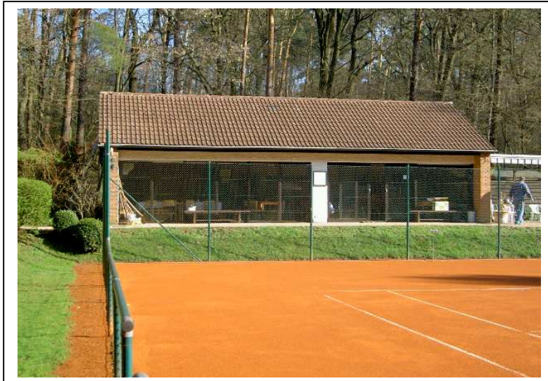
Clubhaus 1978, 2. Bauabschnitt

1978 Erweiterung unseres Clubhauses, die Einweihung wird im Juni gefeiert.