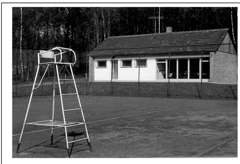
Clubhaus 1967, 1. Bauabschnitt